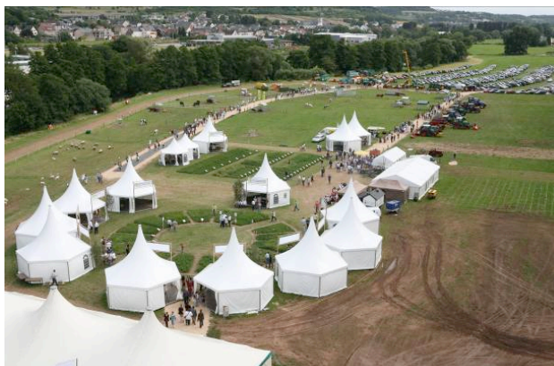
Journées internationales de la prairie 2008 à Ettelbruck

Cette année, lors de la Foire agricole d'Ettelbruck, 65 scientifiques et conseillers issus de 17 organismes vont informer les exploitants agricoles, les conseillers ainsi que le grand public sur différents thèmes liés à la production laitière à partir d'herbe. En outre, ces journées sont une occasion unique de rencontre et d'échanges professionnels pour tous les participants.