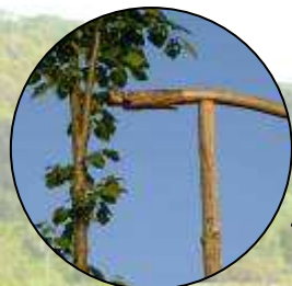
Perchoir à rapaces