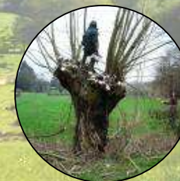
Entretien des arbres têtards