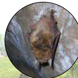
Chauve-souris et nichoirs

Taille de haie en forme de pyramide Deux passages au lieu de trois Haie plus large à la base : - Clôture - Espace de vie pour la petite faune