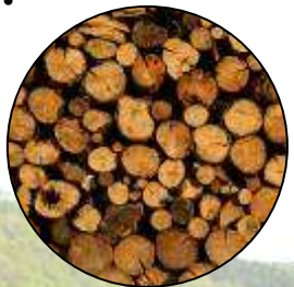
Bois de chauffage