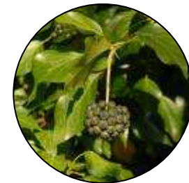
Baie de lierre, nourriture pour les oiseaux