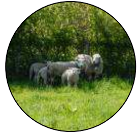
Moutons à l'abris du soleil