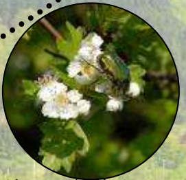
Cétoine dorée butinant une fleur d'aubépine