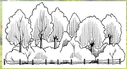
Haie haute libre (buissons, arbustes, arbres)