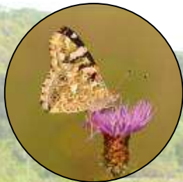
Belle-Dame butinant une centaurée