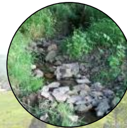
Protection du cours d'eau