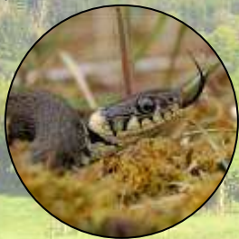
Couleuvre à collier